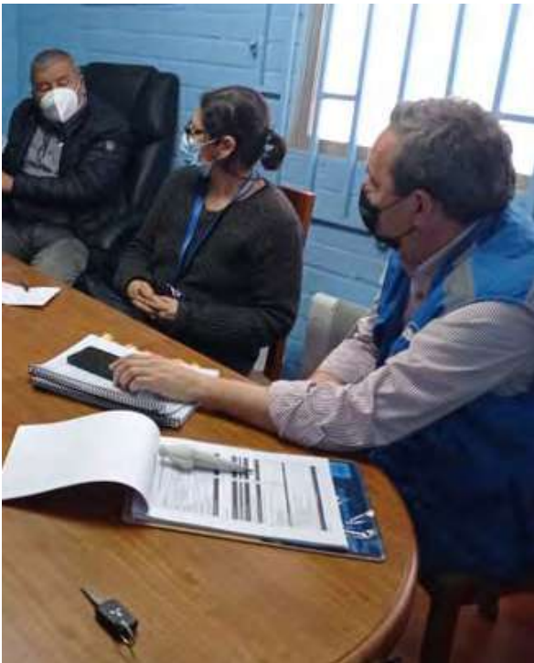
Cuadro N° 2